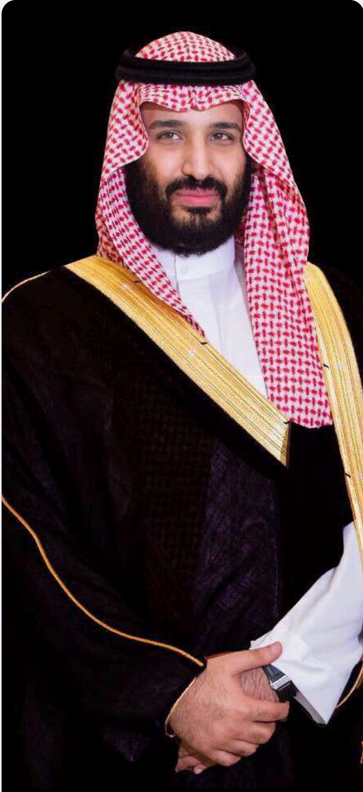
صاحب السمو الملكي الأمير محمد بن سلمان بن عبدالعزيز