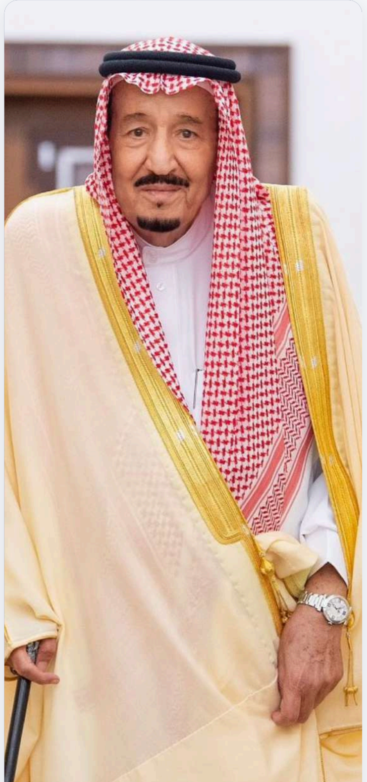
خادم الحرمين الشريفين الملك سلمان بن عبدالعزيز آل سعود

"العمل التطوعي والخيري ركيزة أساسية في بناء مجتمع متماسك، وهو جزء لا يتجزأ من